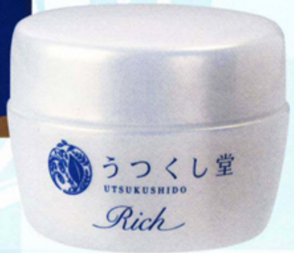
うつくし堂 クリームRich 55g 3,150円(税込) 無香料/無着色/無鉱物油

すっとのびて、しっとりうるおい持続。 翌日の手触りがうれしい。 植物と水の恵みでもっと健やかな肌へと導きます。